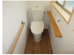
和風便器から洋風便器への交換 座高の低い洋風便器の交換