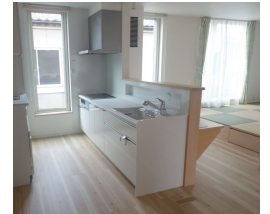
システムキッチン入替工事