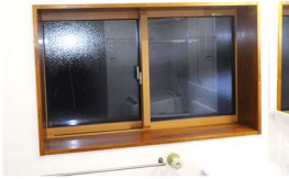
断熱サッシ取付け